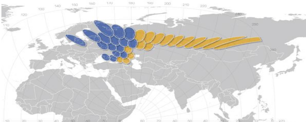
Рис.1 Зона покрытия Ямал - 601